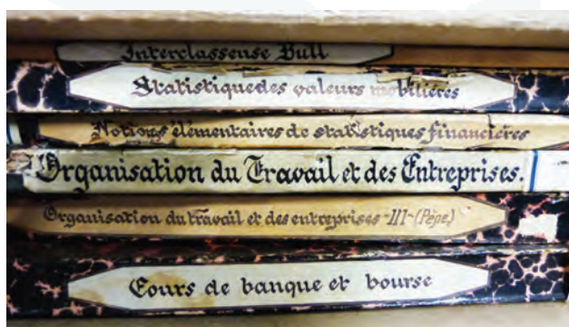
Figure 6. Des manuscrits du XX e siècle