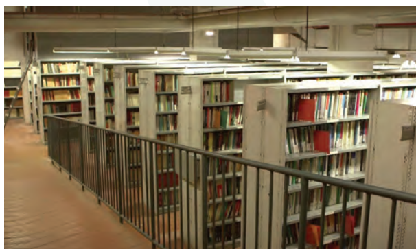
Figure 3 / 4. Réserves de la bibliothèque dans les locaux de la direction générale