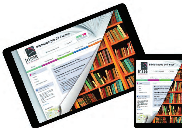
Figure 1. Logo de la bibliothèque de l'Insee

La bibliothèque de l'Insee a été créée en même temps que l'Institut. Sa constitution, entre 1946 et 1951, s'est effectuée par la réunion des fonds documentaires de quatre services emblématiques :