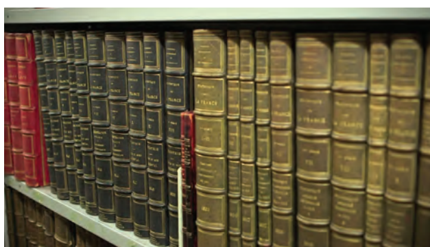
Figure 5. Anciens volumes de la Statistique Générale de la France...